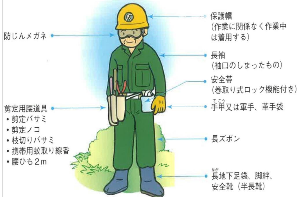
※安全就業のためのチェックポイントより抜粋